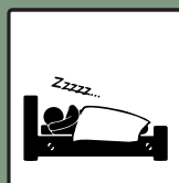
ช่วยให้นอนหลับสบาย