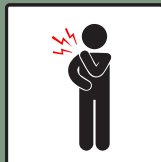
ลดอาการปวด อาการอื่นต่างๆ