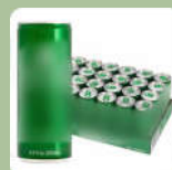
เครื่องใช้ในครัวเรือน