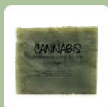
สมุนไพรกัญชา