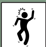
ลดอาการอาเจียน อาการอื่นที่กระทบต่อการทำงานของมือ