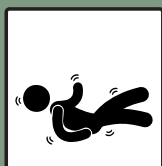
ลดอาการโรคซึมเศร้า