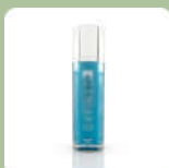
ผลิตภัณฑ์บำรุงสายตา