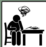
ลดอาการ คลื่นไส้ อาเจียน ทำให้จดจำอาหาร