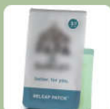
แผ่นประคบแก้ปวด